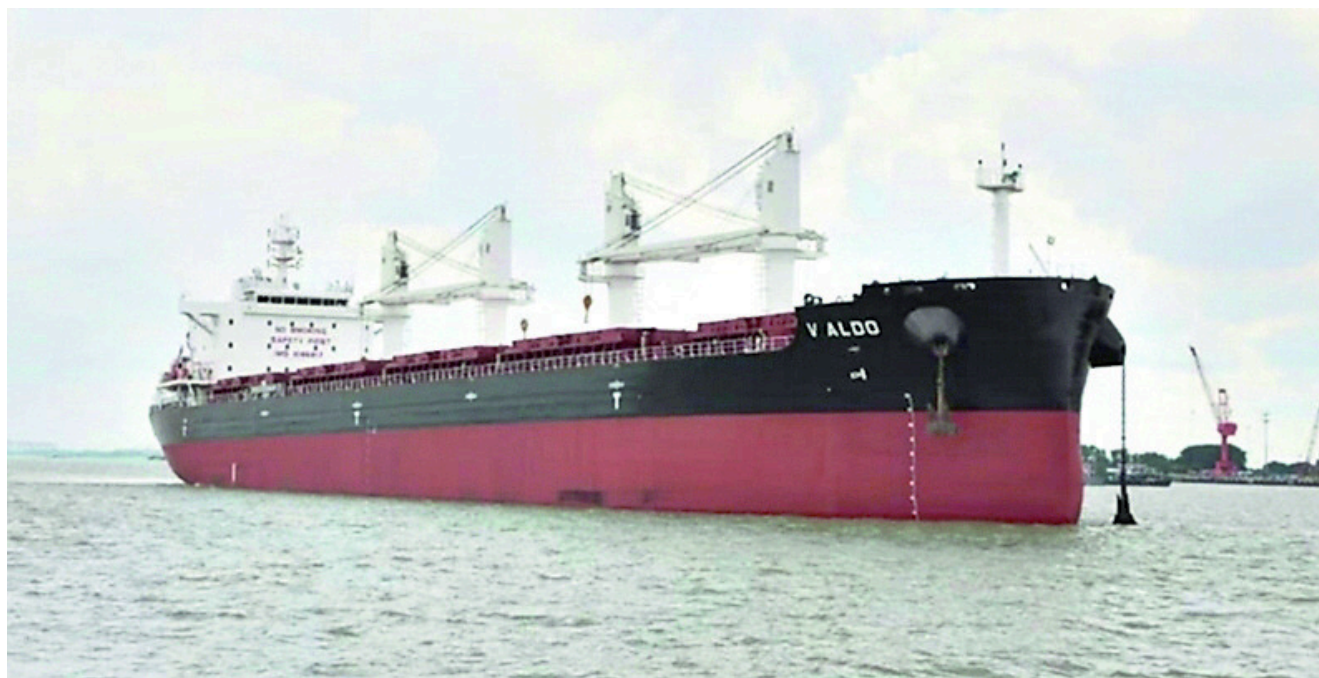
La V Aldo, nuova nave della compagnia Visentini

La lettera del gruppo dello shipping che annuncia l'addio all'associazione. Escluso per ora l'ingresso in Assarmatori